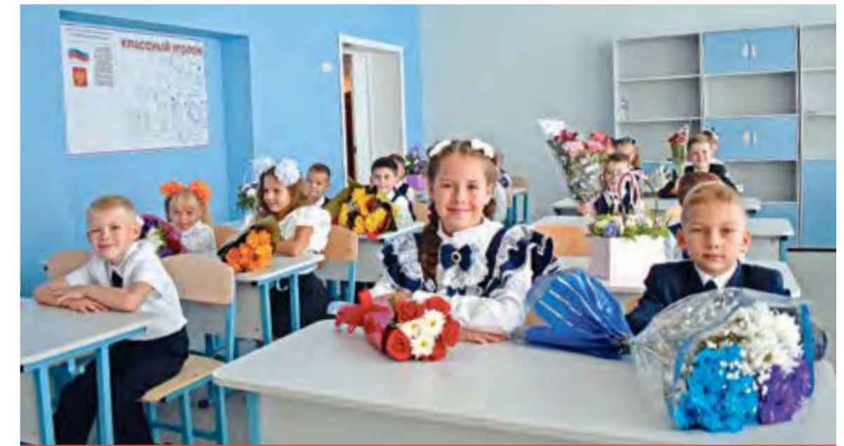
Первоклассники обживают новые помещения