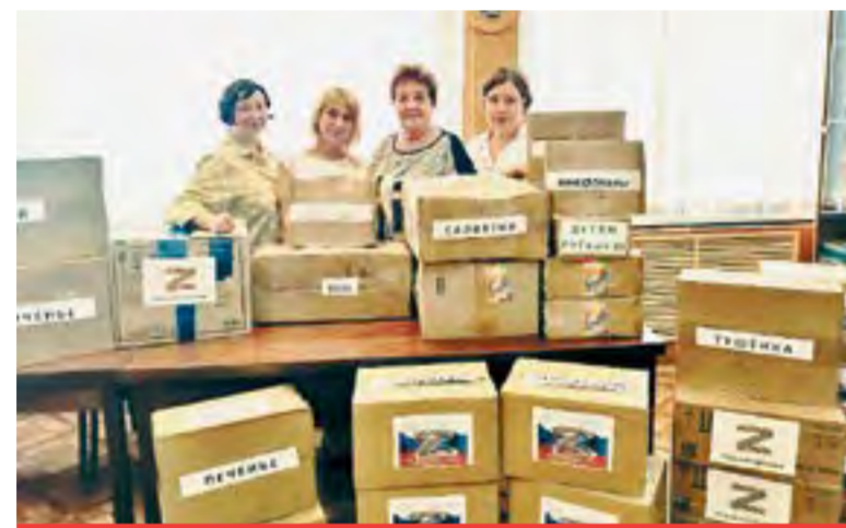
Сотрудники оборонного завода — с очередным гуманитарным грузом

ски с первых дней после начала спецоперации. Отвозили заводчане и на своем автомобиле гуманитарный груз пострадавшим от обстрелов в приграничных зонах Белгородской области.