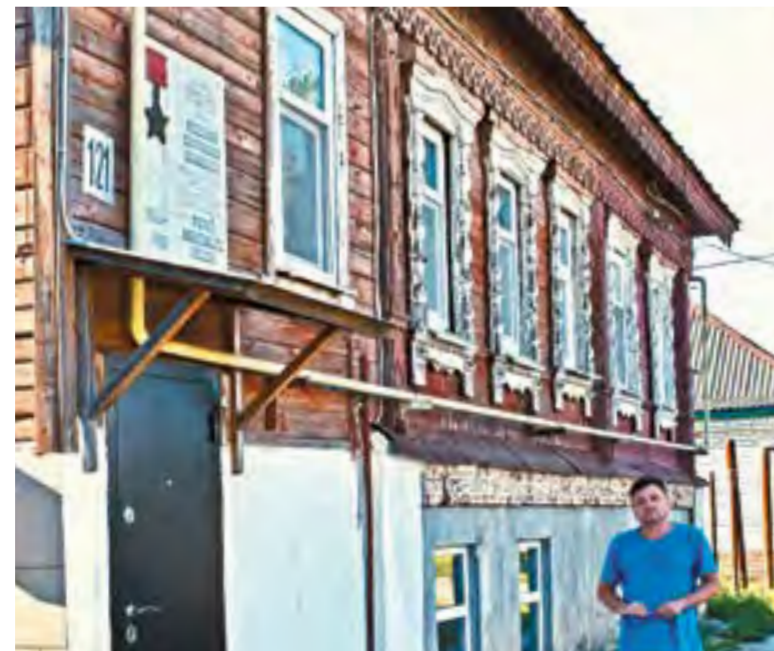
Дом, в котором жил Митрофан Неделин

Здание — двухэтажное, кирпичное. Главный фасад имеет декоративную отделку в стиле эклектики. В советское время здесь также располагались телеграф и почта. Позже в здании оставили один телеграф, а почту перевели в другое помещение — на угол улицы Карла Маркса и Советской, где она размещается и в настоящее время.