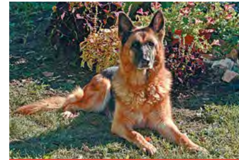
Овчарка по кличке Солнечная Дубрава — бабушка щенков, которых отправили в Адыгею